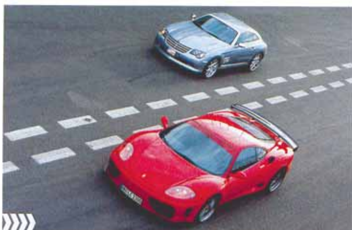
Kompakte Kracher: vier Meter Chrysler gegen vier Meter fünfzig Ferrari

(Busch-)Mann, wie ich mich da getäuscht habe. Was der Bodo aus deutschen Großserien-Genen komponiert hat, das klebt dem LC dreist am Diffusor. Er kann den Roten aber nicht überholen. Der ihn aber auch nur schwer. Grund: Der große Heckflügel des Ferrari verbessert zwar den Abtrieb, verringert dafür die Höchstgeschwindigkeit.