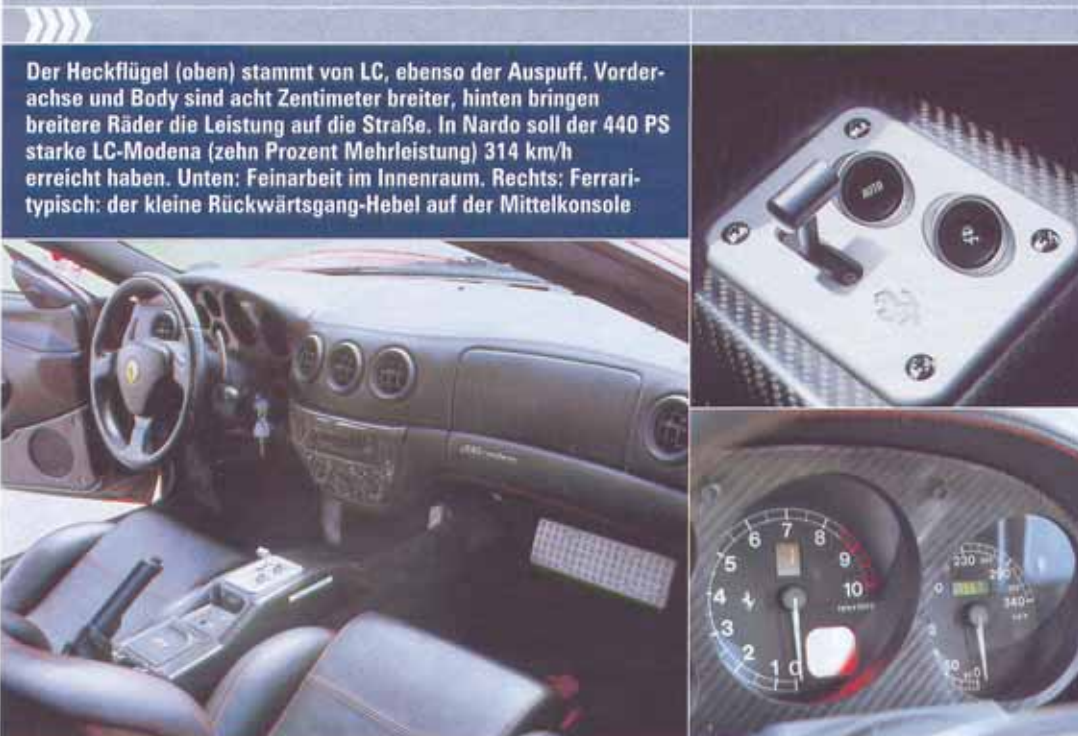
Der Heckflügel (oben) stammt von LC, ebenso der Auspuff. Vorderachse und Body sind acht Zentimeter breiter, hinten bringen breitere Räder die Leistung auf die Straße. In Nardo soll der 440 PS starke LC-Modena (zehn Prozent Mehrleistung) 314 km/h erreicht haben. Unten: Feinarbeit im Innenraum. Rechts: Ferrari-typisch: der kleine Rückwärtsgang-Hebel auf der Mittelkonsole